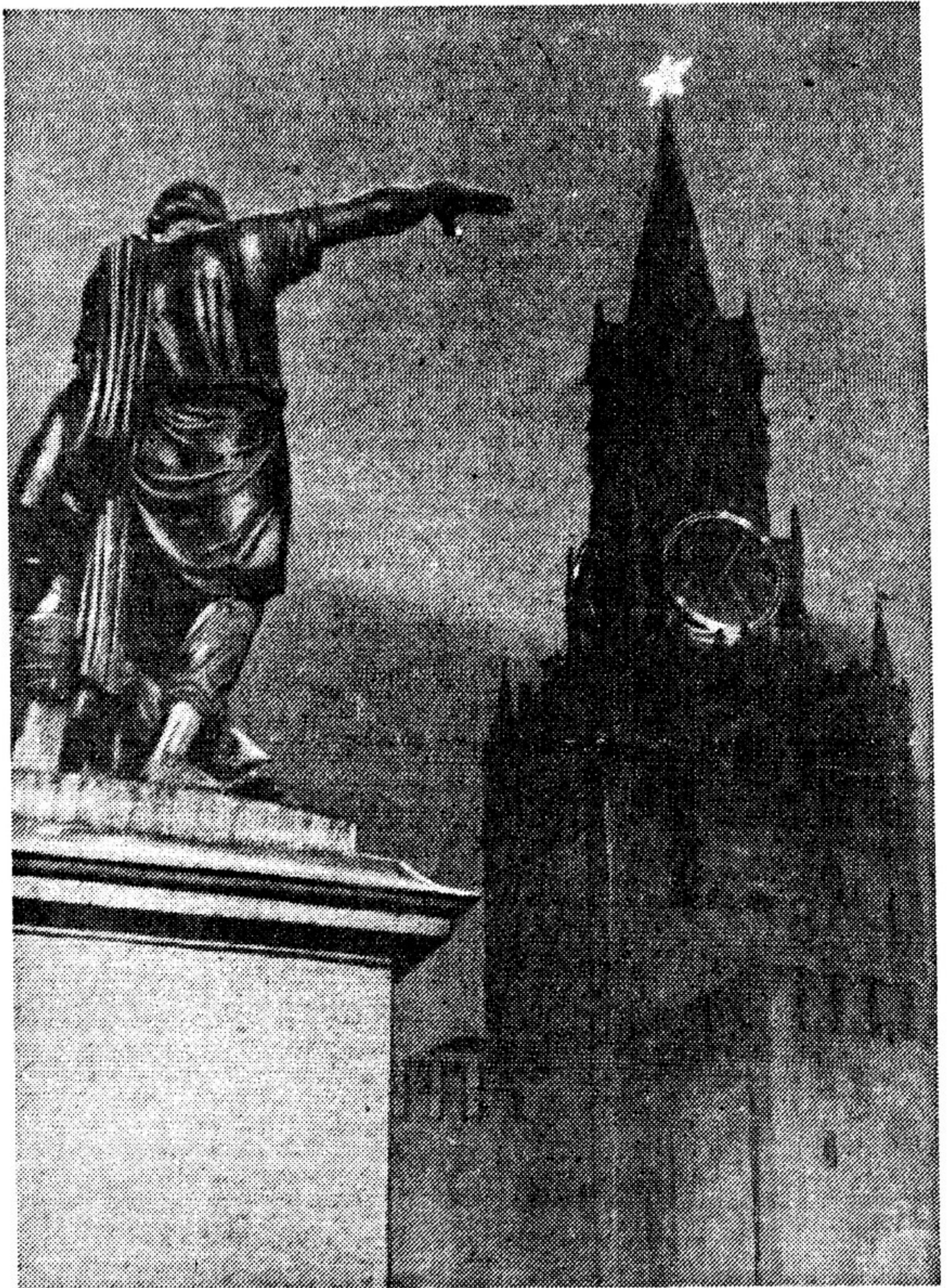
На Красной площади

Может быть, впервые в жизни я с такой ясностью понял, чем должна быть наша литература: это, как патроны, как хлеб, как зная в бою.