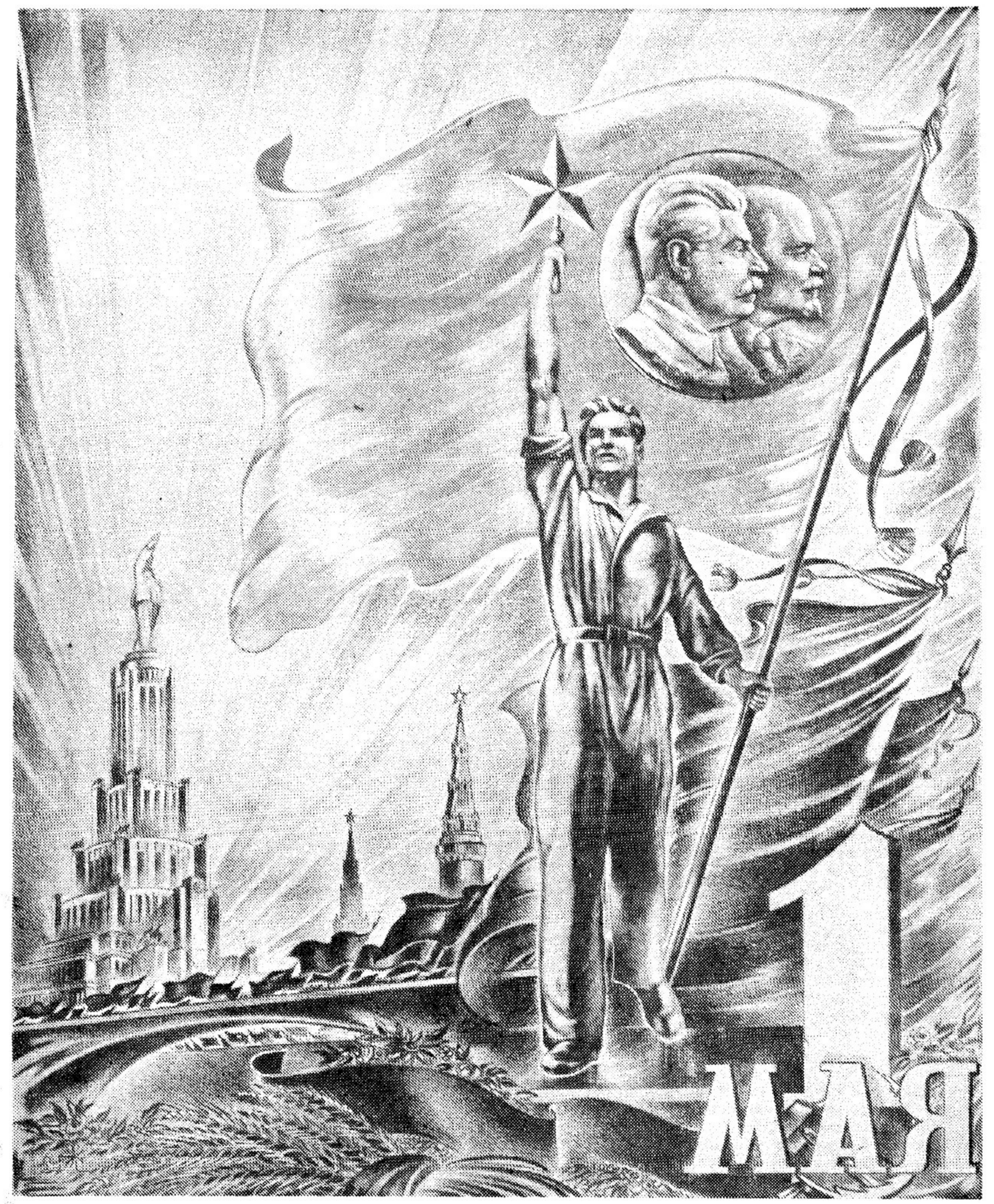
Композиция художника Н. Фидлера.